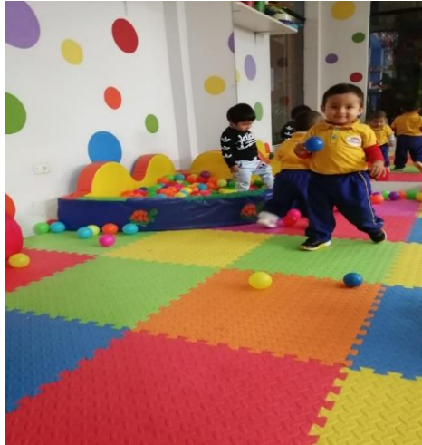
Figura 1 Salón de psicomotricidad de C.E.T. PEQUEÑITOS

Por eso tengo un profundo agradecimiento a mis maestros, personal administrativo de la Universidad José Carlos Mariátegui por su noble apoyo a mi persona, por ser parte de mi formación profesional.