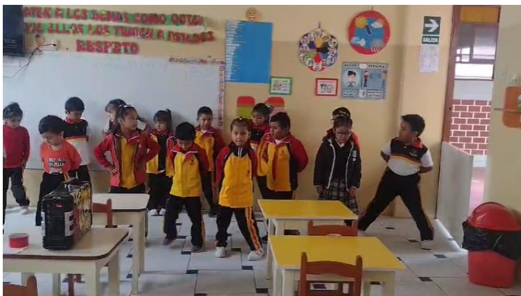
Participación Dinamia Cristiana