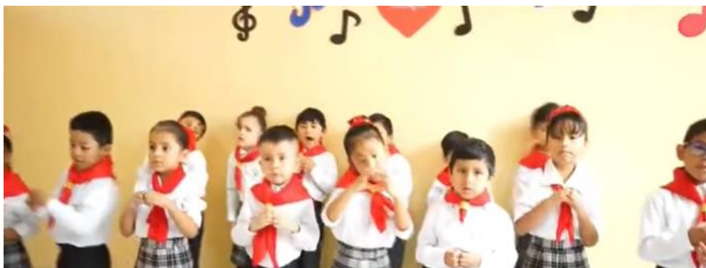
Figura 6 Formación de los niños de 4 y 5 años

En resumen, en la institución Betesda School en Ilo, se ha trabajado de manera integral en la formación de los niños de 4 y 5 años, promoviendo la importancia de los valores cristianos a través de diversas actividades y experiencias que buscan fortalecer su desarrollo espiritual, moral y social