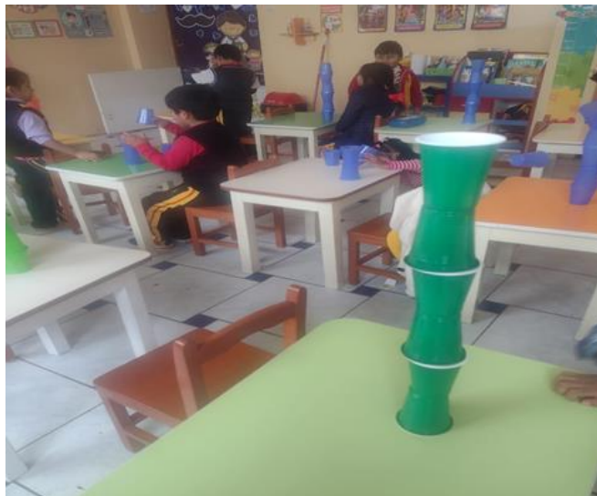
Juego torre de color

En este juego usado como estrategia se llama "Mi torre de color" donde los niños de 5 años aprenderán sobre la historia "La torre de babel" los personajes de la historia solo pensaban en sí mismas y no en los demás, la enseñanza de la historia que nos da es que Dios quiere que trabajen juntos con ayuda de sus talentos y habilidades para ayudar al prójimo como también a servirle a Dios. Este juego consiste en que cada niño se les dará vasitos de color para que ellos armen su torre en cuanto tiempo demoran en armar su torre y la importancia de hacerlo en equipo y no solo.