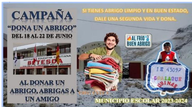
Figura 5 Campaña dona un abrigo